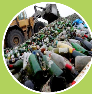
Ley General para la Prevención y Gestión de Residuos Sólidos