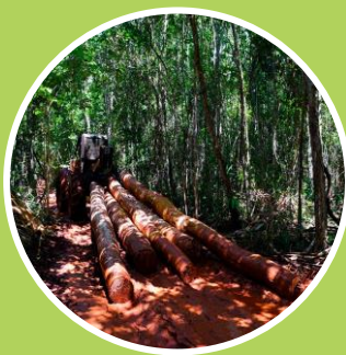
Ley de Desarrollo Forestal Sustentable