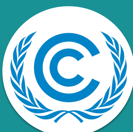
Convención Marco de las Naciones Unidas sobre el Cambio Climático y su Protocolo de Kioto