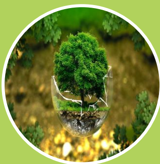
Ley General del Equilibrio Ecológico y Protección Ambiental