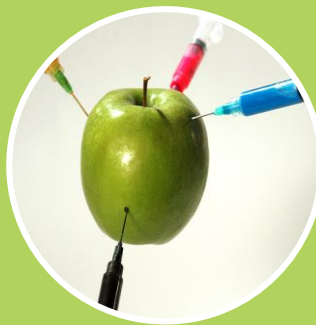
Ley Bioseguridad y organismos Genéticamente Modificados