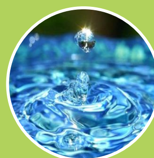
Ley Aguas Nacionales