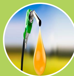
Ley Promoción y desarrollo de los Bioenergéticos