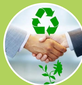
Ley Responsabilidad Ambiental

Las normas ambientales son estándares de cumplimiento específicos que tienen como objetivo de garantizar las mínimas repercusiones en el medio ambiente de actividades relativas a materiales, productos y procesos de producción.