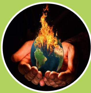
Ley General de Cambio Climático