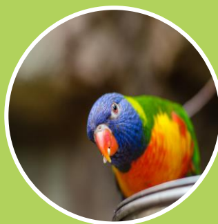
Ley General de Vida Silvestre